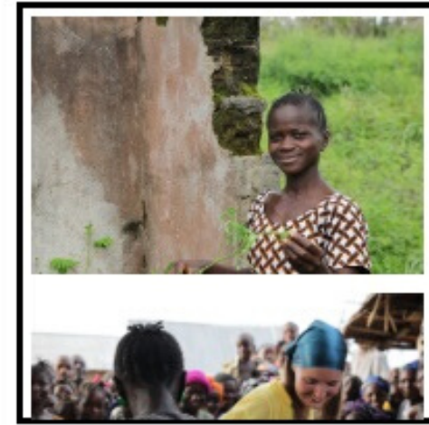
Кадри з фільму